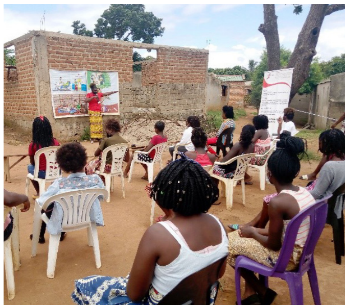
Pathfinder International em Moçambique, 2022