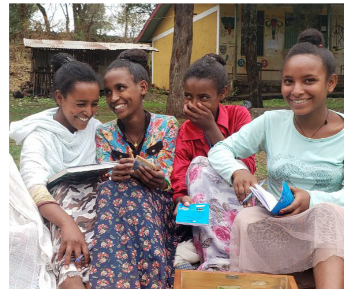
Pathfinder International Etiópia. Membros do comité da associação de poupança e empréstimo da aldeia reúnem-se na região de Amhara.