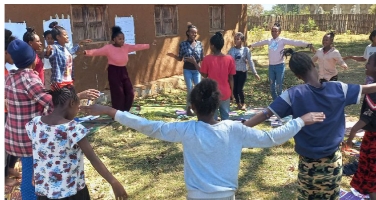
Pathfinder Internacional Etiópia. Os mentores facilitam uma sessão na Região das Nações, Nacionalidades e Povos do Sul (SNNPR).

de género é fundamental para inspirá-los a tornarem-se homens que vivem de acordo com princípios equitativos de género. O programa do projeto AWH enfatiza a realidade de que lidar com questões de raparigas e mulheres é responsabilidade de todos. Após um curto período de tempo, dezenas de rapazes de diferentes regiões relataram não só ter contribuído para cancelar os casamentos de suas irmãs e vizinhas adolescentes, mas também ter-se comprometido a casar com raparigas maiores de 18 anos mais tarde em suas vidas. Para além dos seus papéis como aliados, a Pathfinder reconhece que os rapazes enfrentam os seus próprios desafios de género, tais como o consumo de drogas e violência. O AWH reviu o currículo do projeto para incluir módulos focados nesses temas.