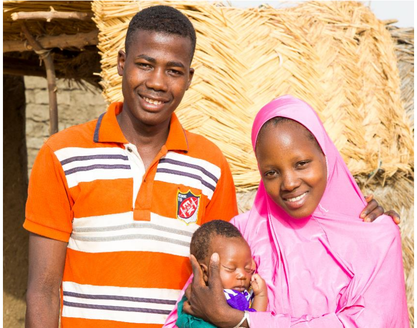
Un jeune couple bénéficiant de notre programme de planning familial et leur enfant dans le village de Manoufouré, au Niger.

Pathfinder a établi des partenariats avec les systèmes de santé publique de plus de 70 pays pour faire progresser la santé et les droits sexuels et reproductifs ainsi que l'égalité des sexes. Nous sommes surtout connus pour accroître l'accès à la contraception et aux services de santé reproductive dans les collectivités mal desservies, et pour appliquer des approches communautaires dirigées par des partenaires locaux de confiance. Pathfinder est animée par la conviction que toutes les personnes, quel que soit l'endroit où elles vivent, ont le droit de décider d'avoir d'enfants ou pas, et quand les avoir, d'exister à l'abri de la peur et de la stigmatisation, et de mener la vie qu'elles choisissent.