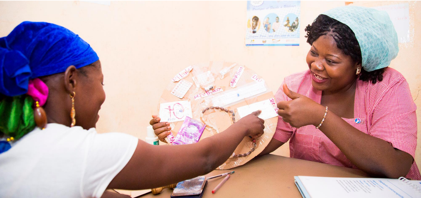
Un agent de santé explique des méthodes contraceptives à une cliente à Bobo Dioulasso, au Burkina Faso.